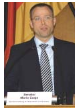
Mario Czaja, Senator für Gesundheit und Soziales