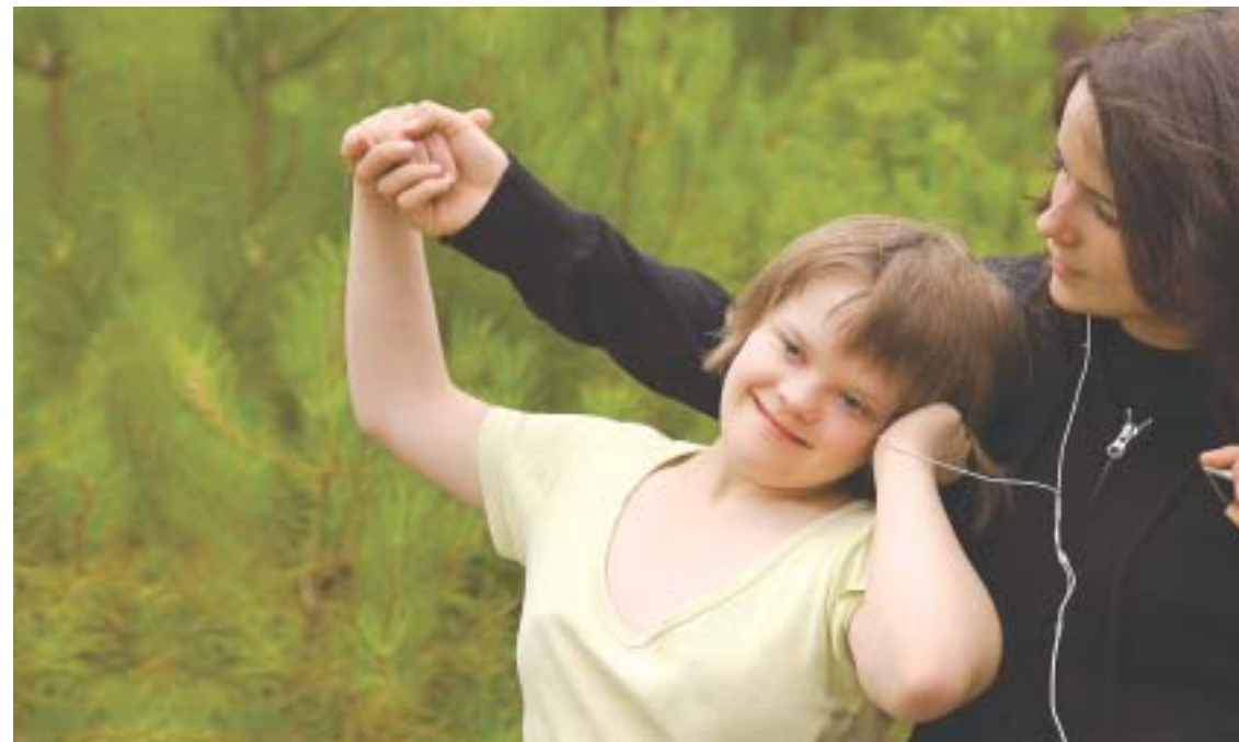
Pflege zuhause ist mit viel Verantwortung und sehr hohem persönlichen Einsatz verbunden