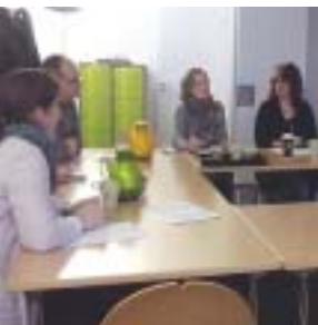
Viele Treffen und Besprechungen folgten, um diese Idee umzusetzen