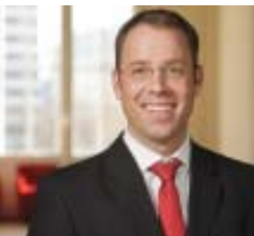
Mario Czaja , Senator für Gesundheit und Soziales des Landes Berlin