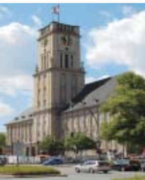
Rathaus Schöneberg, der Veranstaltungsort für die Eröffnung am 24. September 2012