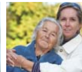
Pflegende Angehörige brauchen unsere Hilfe und Anerkennung