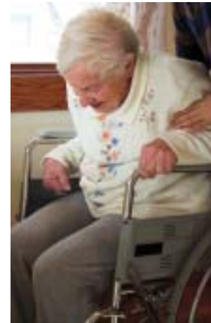
In Berlin sind heute etwa 170.000 Menschen in die private Pflege von Angehörigen, Lebenspartnern, Freunden und Nachbarn eingebunden

Die „Woche der pflegenden Angehörigen“ zum gemeinsamen Ziel über Tätigkeitsfelder, Aufgabebereiche und Trägergrenzen hinweg zu machen war eine große Herausforderung.